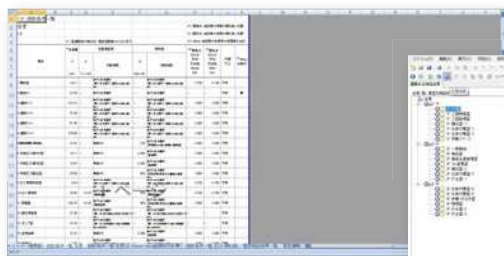
計算ソフトウェア画面